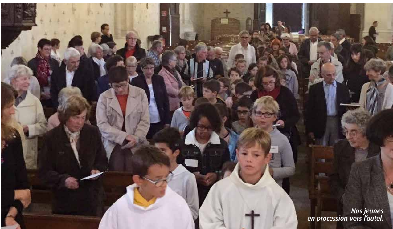
Nos jeunes en procession vers l'autel.