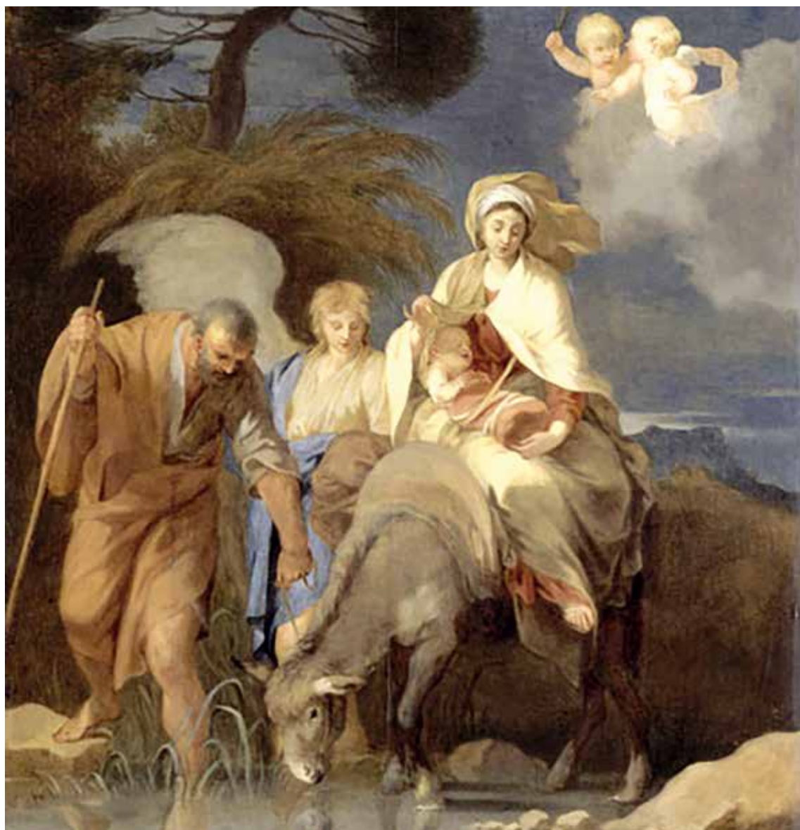
La fuite en Égypte, de Sébastien Bourdon.