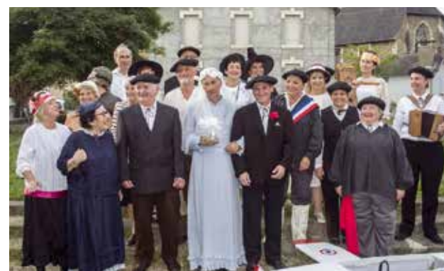
Le mariage de Caddetou.