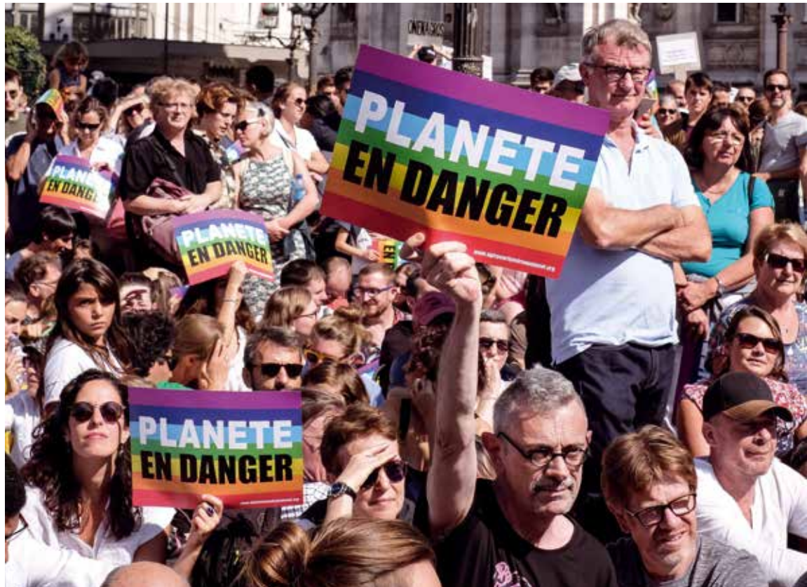
8 septembre 2018, marche pour le climat.

Pour nous, simples citoyens, nous pouvons agir aussi en s'attaquant au gaspillage, en