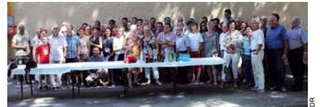
Moment de convivialité avec nos amis bavarois.

Nos amis bavarois de Windberg ont passé un séjour en Béarn, dans le cadre du jumelage qui perdure depuis 1983. La photo de famille du groupe allemand avec leurs hôtes abosiens parachève une journée grillades, à la salle polyvalente. Les nombreuses visites ont enchanté les trente-deux Bavarois venus cette année. Après les Pyrénées (avec Lourdes), la Soule et Mauléon, Pau et son château, la visite d'un chai de Jurançon et San Sébastien, la dernière journée à Abos a permis de vivre des moments de joie et de convivialité, autour de jeux et d'échanges. Le rendez-vous est pris pour l'an prochain en Bavière.