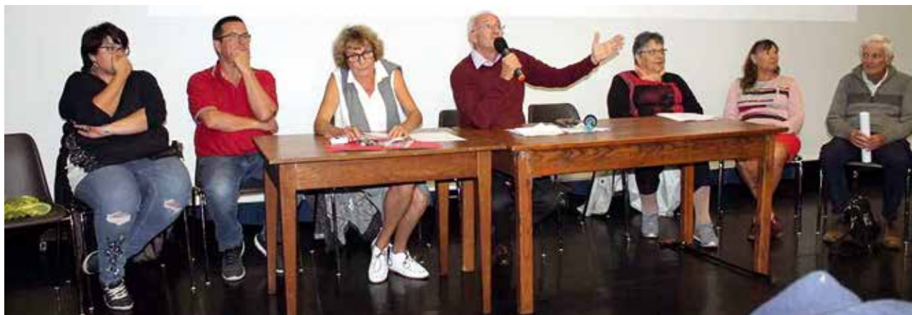
L'assemblée générale du foyer rural.