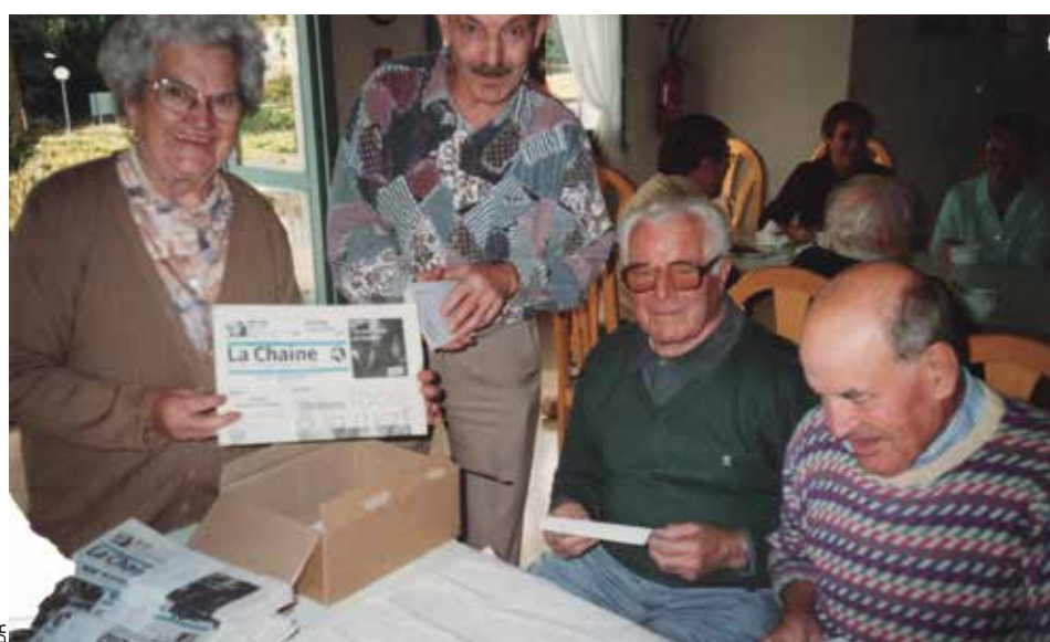
La Marpa œuvre pour La Chaîne.

Conçue pour accueillir vingt personnes dans une ambiance familiale qui respecte l'individualité de chacun, elle dispense des