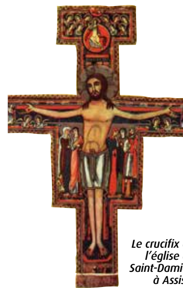
Le crucifix de l'église de Saint-Damien à Assise.