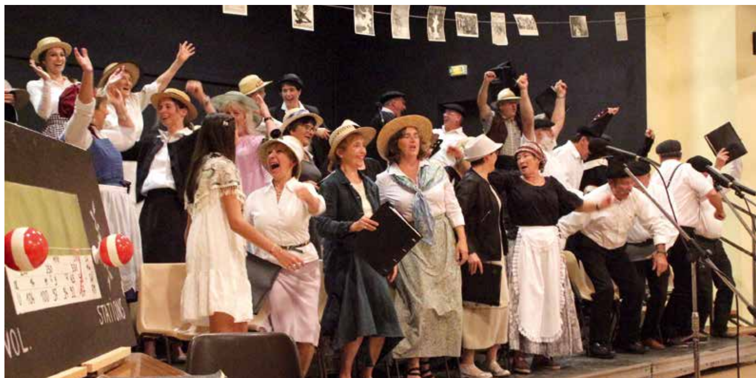
La guerre est finie !

La chanson de Craonne, interprétée par Charles, nous rappelait la lassitude des soldats après l'échec et les terribles pertes de l'offensive du Chemin des Dames en avril 1917 : « Nous sommes tous condamnés, nous sommes les sacrifiés », clame-t-il, rappelant les témoignages de nos anciens,