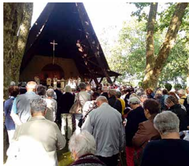
Chapelle des Miracles à Buglose.