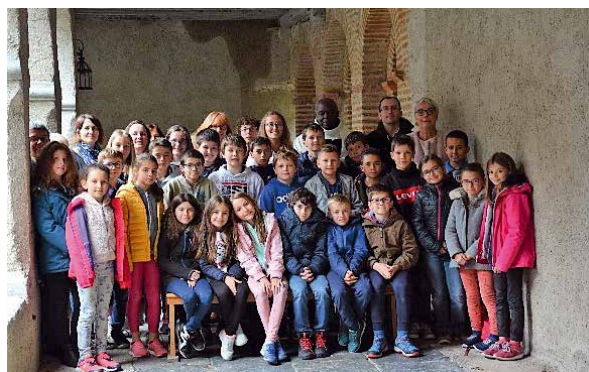
Retraite au cloître de Sarrance.

• au partage eucharistique qui crée une relation personnelle au Christ présent « Prenez et mangez-en tous, ceci est mon corps... ceci est mon sang livré pour vous ».