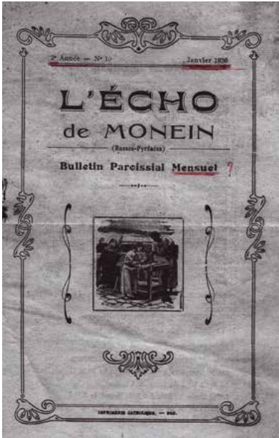
L'écho de Monein.

Un paroissien lecteur de notre journal La Chaîne a joint dans son enveloppe d'abonnement trois photocopies de documents anciens : - en janvier 1936 paraissait le 10 e numéro de l'Écho de Monein , bulletin paroissial mensuel. Voilà 84 ans que ce lien entre paroissiens est édité. - l'inauguration le 27 septembre 1931 à Monein, de la statue de Sainte Thérèse de Lisieux. - la prière au Sacré-Cœur de Jésus avec les promesses de notre Seigneur à Sainte-Marie-Marguerite. Ces années-là, une journée de fête du Sacré-Cœur était organisée en paroisse avec ces recommandations particulières : • Communier en esprit de reconnaissance et réparation, • Consacrer nos personnes, famille, patrie au cœur très aimant du Sauveur, • Répandre la dévotion au Sacré-Cœur unique et suprême espoir de l'Église • Assister aux offices de la paroisse. Ce clin d'œil aux pratiques religieuses passées nous questionne sur nos pratiques personnelles.