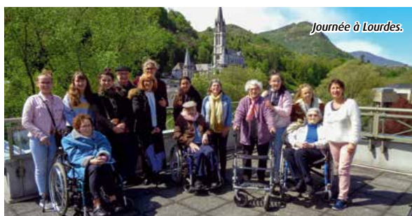
Journée à Lourdes.

Ensuite, nous avons croisé un groupe de musique et nous avons tous dansé