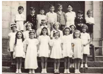
Les anges gardiens.

On les fête le 2 octobre depuis l'an 1608. Le pape Benoît XVI disait d'eux : « Ils marchent à côté de nous, ils nous protègent en toutes circonstances, ils nous défendent dans les dangers et nous pouvons avoir recours à eux à tout moment ». N'oublions pas de les solliciter !