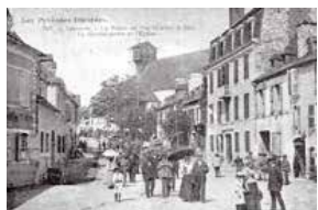
Carte postale d'antan.

Nos résidents se souviennent aussi du temps où les communions solennelles, profession de foi aujourd'hui, rassemblaient près de cinquante enfants.