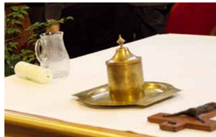
Symboles du baptême.

Dans la petite salle où il y a des barreaux aux fenêtres, une porte fermée à clé, des bruits peu sympathiques venant des couloirs, la paix et le recueillement s'installent. Le détenu reçoit le baptême et lit un long et beau