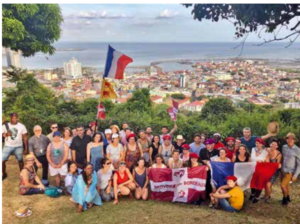
L'équipe "Aquitaine" aux JMJ de Panama.

Pour vous expliquer comment j'ai ressenti cette confession, je vais prendre l'exemple d'un barrage. En haut, vous avez le lac rempli d'eau qui représente Dieu et son amour pour vous. En bas, vous avez la petite rivière, presque sèche qui vous représente avec un peu d'amour de Dieu. L'eau s'écoule par filet du barrage et vous éclabousse d'amour. Puis arrive le jour où vous allez vous confesser. Vous demandez pardon à Dieu, et là le barrage du péché