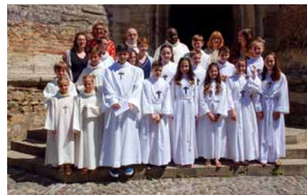
Nos jeunes sur le parvis de l'église.

Cette année, 11 jeunes de 6 e se sont préparés à la profession de foi vécue en deux temps. Tout d'abord, le samedi 15 juin au soir, en l'église de Lasseube, ils ont pu lire leur credo au cours d'une veillée chaleureuse et familiale.