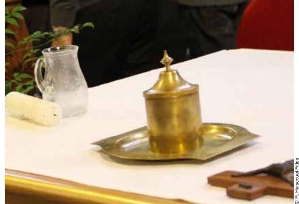
Les symboles du baptême.

Pendant ce temps du catéchuménat, les personnes apprennent à connaître Jésus et son enseignement, la relation à Dieu dans la prière et la vie en Église. Quand un adulte demande le