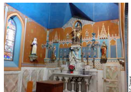
La chapelle rénovée, elle a retrouvé toute sa splendeur.