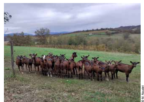
Les chèvres de Cuqueron.