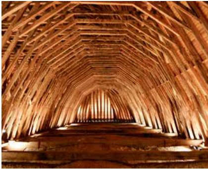
Charpente de l'église de Monein.

En pérégrinant sur le chemin NOTRE AMI SAINT JACQUES