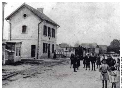
Gare des tramways, route de Monein à Abos en 1900.