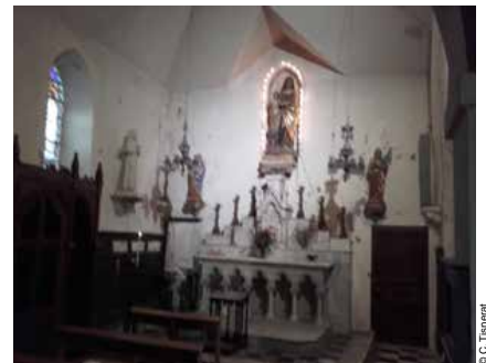
L'autel de la Vierge avant rénovation.