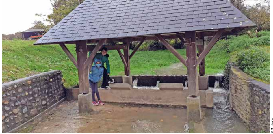
Le lavoir de Lahourcade.

Avec mes petits-enfants, grâce à un jeu téléchargé sur le téléphone, nous avons parcouru les chemins communaux, à la recherche d'un élément informatisé, enfermé dans un cylindre et caché dans divers lieux, à travers notre territoire paroissial.