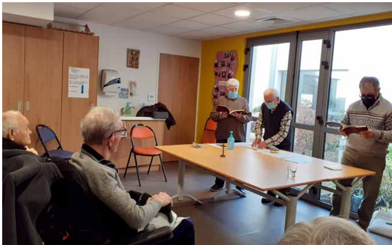
Partage eucharistique à l'Ehpad la Roussane.