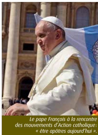
Le pape François à la rencontre des mouvements d'Action catholique : « être apôtres aujourd'hui ».