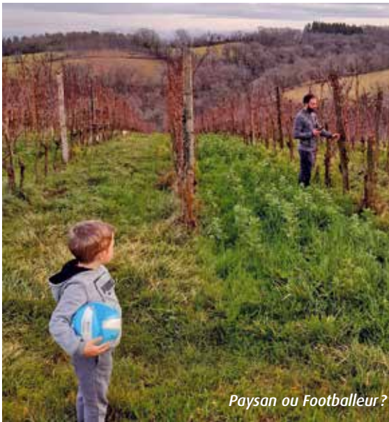
Paysan ou Footballeur?