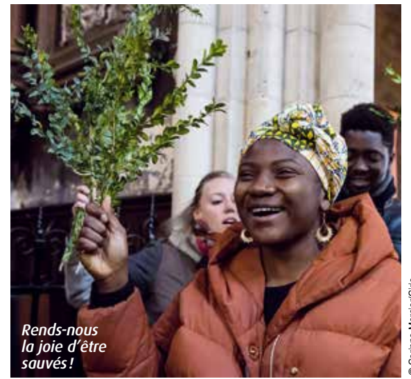
Rends-nous la joie d'être sauvés!