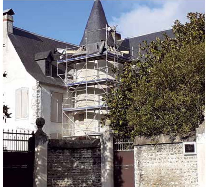
L'abbaye laïque d'Abos où vécut l'écrivain Charles de Bourdeu.

Le regroupement pédagogique Abos-Tarsacq accueille les enfants dès l'âge de trois ans et propose les services « Cantine et Garderie ». Les parcours pédestres « Sportez vous bien », empruntés par de nombreuses personnes extérieures au village, sillonnent les coteaux, la plantation de pins et le vallon de la Baïse. Les lignes de crêtes, exposées plein sud, offrent un panorama sublime sur la chaîne des Pyrénées et les vignobles abosiens. Le Pic-du-Midi d'Ossau,