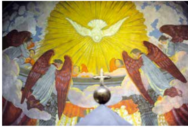
Le Saint-Esprit, détail de La Pentecôte, fresque réalisée par Maurice Denis en 1934, église du Saint-Esprit, Paris.