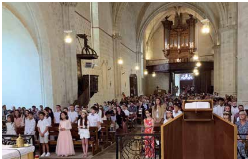
L'église de Monein pleine pour la confirmation.

Nos messes sont plus vivantes, car nous avons la chance aussi d'avoir Jean-Claude Oustaloup qui joue de l'orgue ou anime les cérémonies importantes et chante les psaumes. La chorale élargie, dite paroissiale, intervient pour les fêtes (cérémonies importantes ou fête patronale dans les villages), guidée par Roger Sicabaigt, également organiste. De nouvelles personnes