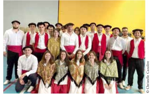
Les membres du comité en costume traditionnel.

L'édition 2023 des fêtes d'Abos a offert une surprise aux personnes présentes au vin d'honneur offert par la municipalité le dimanche midi. Après la célébration religieuse, en l'église Saint-Jean-Baptiste, et la cérémonie au monument aux morts, les habitants se sont dirigés vers la salle polyvalente pour ce rendez-vous convivial où les jeunes membres du comité des fêtes les ont accueillis en costume traditionnel béarnais. Chaque année, pour les fêtes, le mounchico est exécuté par les villageois mais, l'âge étant, les danseurs se font rares. C'est pourquoi les jeunes du comité, souhaitant conserver la tradition, ont appris cette danse béarnaise. Il a fallu apprendre ou réviser les pas, faire des répétitions, ressortir les costumes des valises. Leur motivation ne s'est pas envolée face à ces difficultés et ils ont assuré le spectacle le jour J. Félicitations à eux ! Ils ont témoigné de leur attachement sincère aux coutumes ancestrales, qui peuvent paraître d'un autre temps et aussi démontré l'affection pour leur territoire.