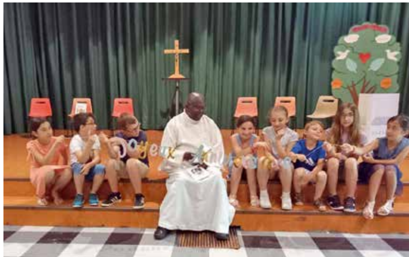
Bon anniversaire monsieur le curé.

plus haut... un peu plus loin la lumière de ton cœur... tu ne sais pas où tu vas, Dieu le sait, ne t'en fais pas », lumière que les enfants ont ensuite apportée aux plus anciens.