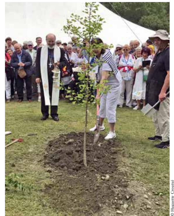
La plantation du ginkgo biloba.