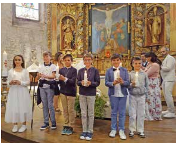
Première communion à Lasseube.