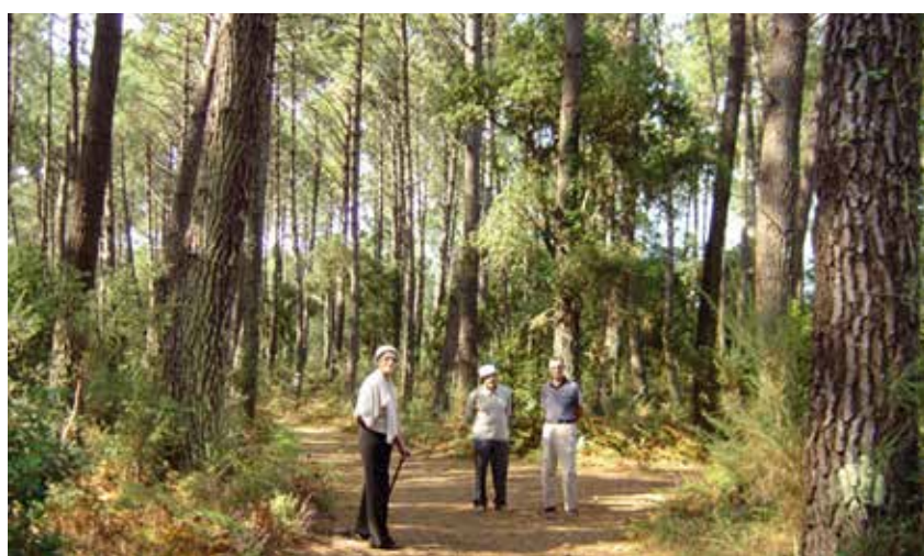
Une forêt vivante et solidaire.

Il me revient en mémoire une journée particulièrement difficile en bordure de mer. Dans le camping, au milieu des pins de cette forêt landaise, un gros orage a éclaté et la foudre est tombée de nombreuses fois en plusieurs endroits. La nuit fut pluvieuse et, au matin, le calme semblait revenu avec le soleil. Les sylviculteurs se sont mis rapidement au travail. « Pourquoi une telle urgence ? » ai-je demandé. « Car il faut déraciner dans la journée tous les arbres touchés, m'a-t-on expliqué. Sans l'arrachage des arbres malades, toute la forêt serait atteinte en peu de temps, appelée à disparaître. » Et de m'expliquer que les arbres sont des êtres vivants et solidaires : quand l'un s'épuise ou n'arrive plus à se nourrir, le réseau de solidarité souterraine s'organise. Le robuste soutient le faible, le plus vieux aide la jeune pousse. Le transfert de nourriture se fait par les racines et les champignons qui les relient,