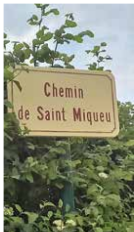
Qui est saint Miqueu ?