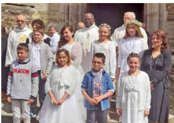
Première communion à Monein.

Les jeudi 18 mai et dimanche 4 juin, à Monein, et le dimanche 21 mai, à Lasseube, quinze enfants de CM2 ont reçu le sacrement de l'Eucharistie. Ils ont cheminé dans l'église, une bougie à la main. Avant de communier pour la première fois, ils ont chanté « Jésus me voici devant toi » avec ferveur et recueillement. Puis ils ont reçu dans leur main l'hostie et communiqué à ce mystère.