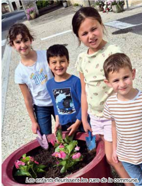
Les enfants fleurissent les rues de la commune.

Une commission extra-communale a été créée par la municipalité avec, comme axe principal, l'implication des habitants dans le fleurissement et la végétalisation de Cardesse. C'est pourquoi, le lundi 12 mai, quelques enfants de l'école, improvisés jardiniers, sont venus embellir le centre bourg en plantant des fleurs achetées par l'association des parents d'élèves Les Petits Chardons à la pépinière du Pré Vert de Laroin. Gauras, bégonias dragon rouge, lavandes et autres fleurs ont donc été enracinés dans des poteries de formes et de couleurs différentes et autres jardinières pour le plaisir des petits comme des grands. Les enfants, fiers de se voir confier cette mission, sont contents de voir grandir leurs plantations et sont prêts à renouveler l'opération.