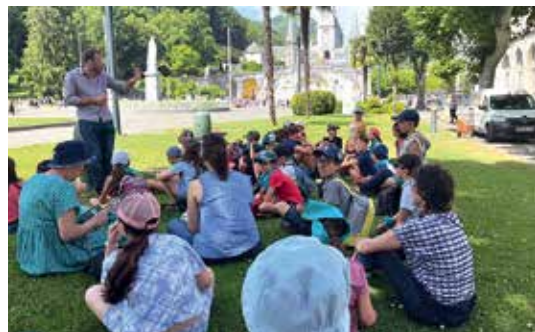
À Lourdes, les enfants ont été captivés par les explications du guide.