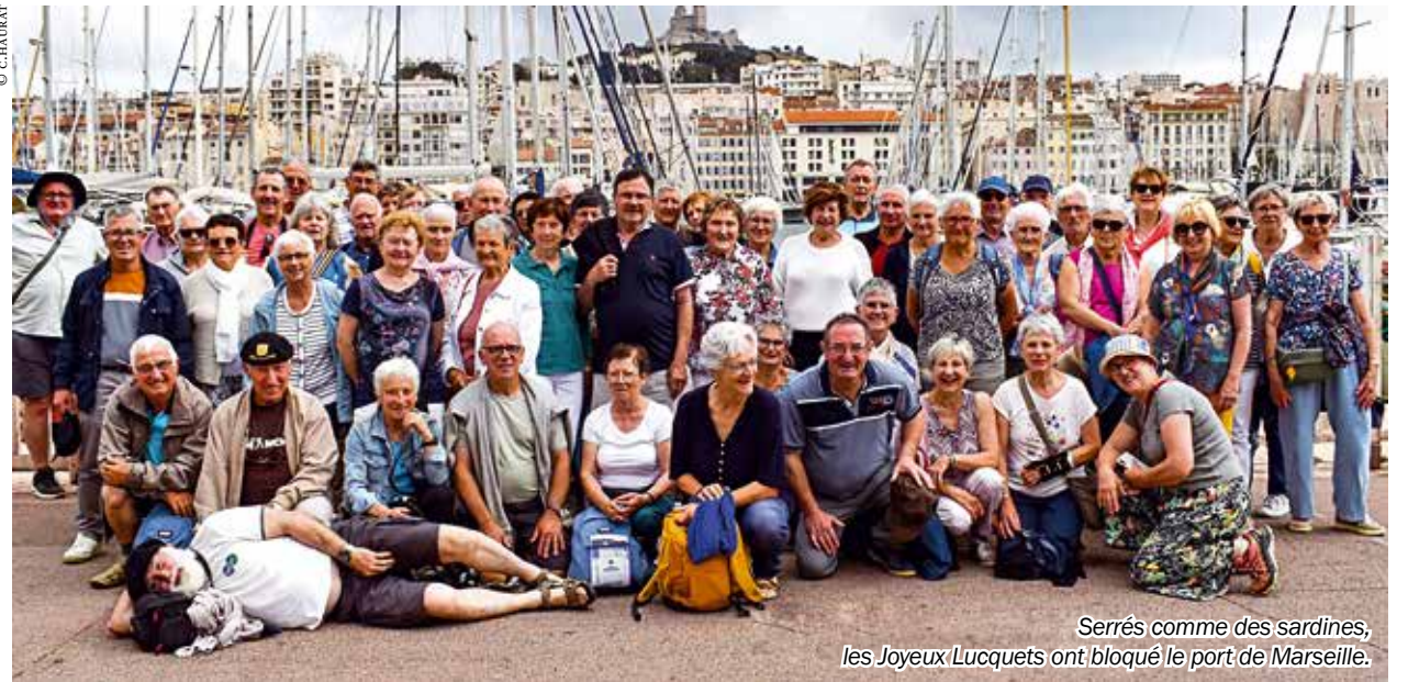
Serrés comme des sardines, les Joyeux Lucquets ont bloqué le port de Marseille.