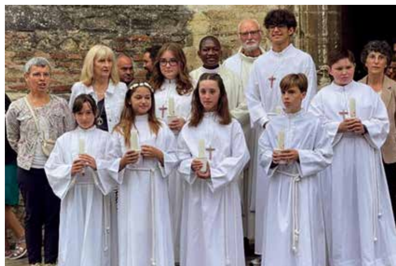
Professions de foi à Monein.