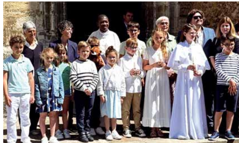
Premières communions à Monein.