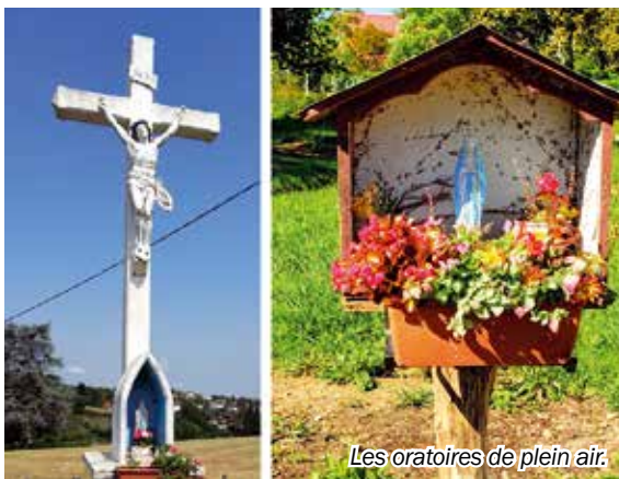
Les oratoires de plein air.

C'est principalement en cheminant à pied dans le village et les quartiers que nous les rencontrons : croix et Vierge de Manos, Vierge du Casterot, Vierge de Largelise ou de l'Apiou, qui sont autant de témoins du passé certes, mais toujours là. Leur entretien délicat, en toutes saisons, démontre une reconnaissance manifeste. Ces sanctuaires de plein air, majestueux ou modestes, entretenus et visités, sont autant de repères spirituels pour les habitants ou les passants. Une simple prière et un bouquet de fleurs des champs sont des bribes de notre pèlerinage terrestre.