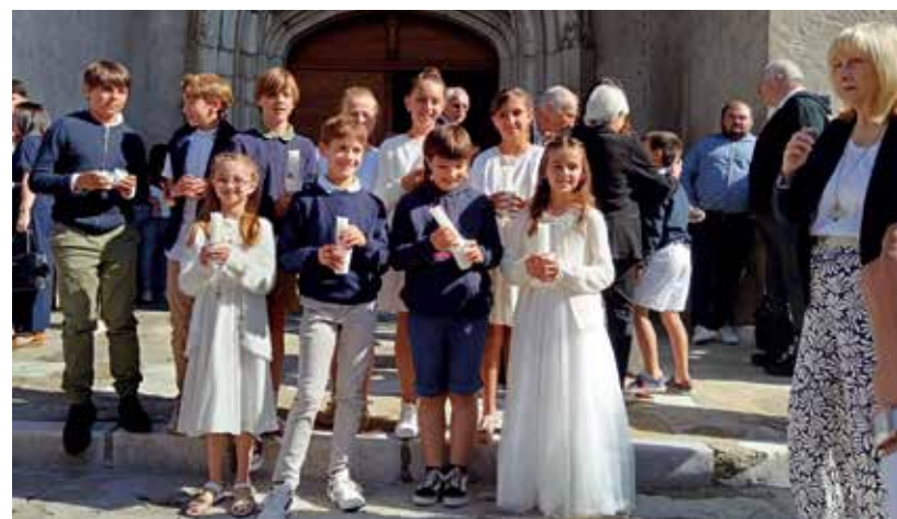
Premières communions à Lasseube.