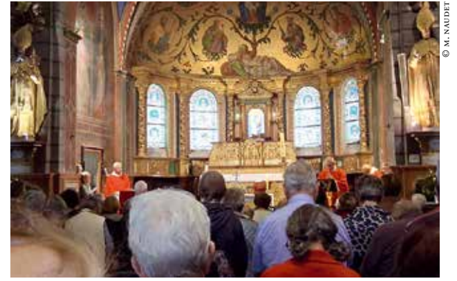
Messe à Sarrance.