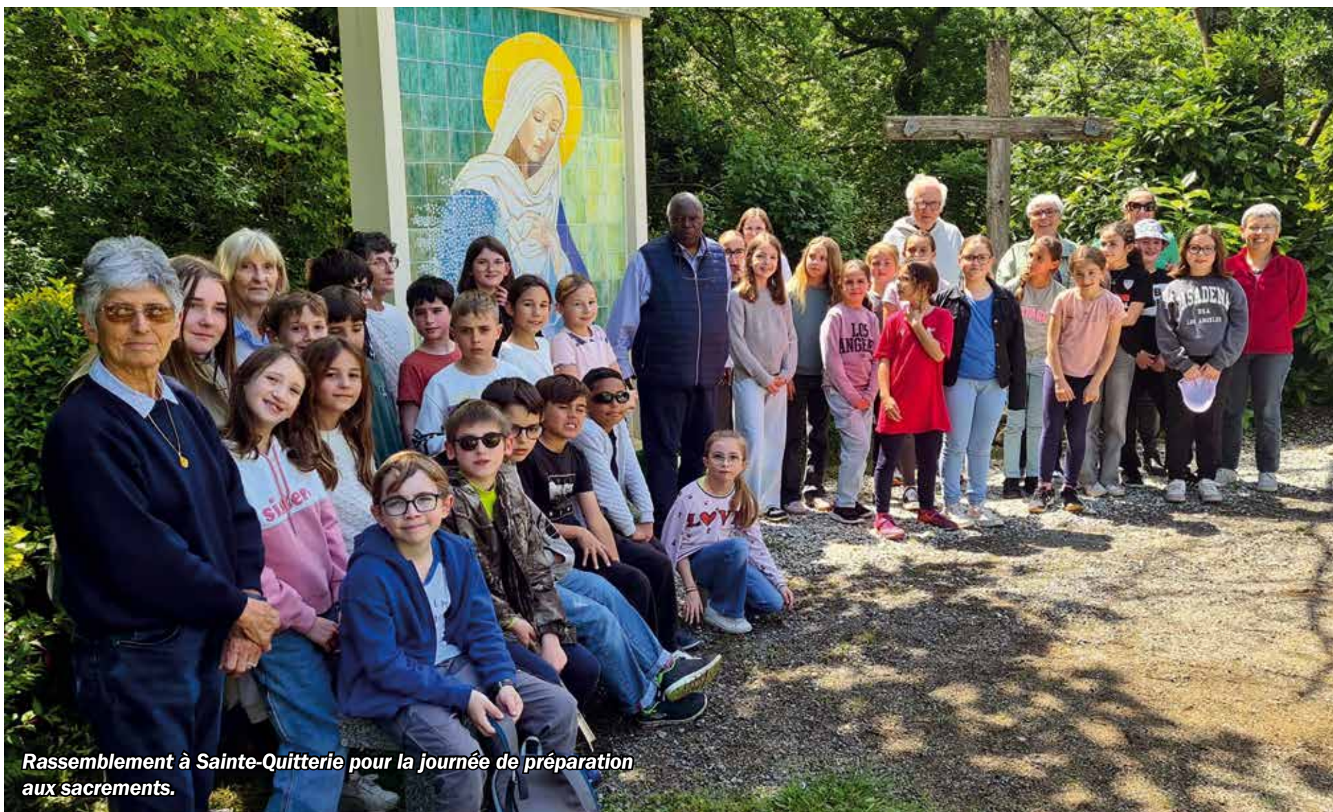
Rassemblement à Sainte-Quitterie pour la journée de préparation aux sacrements.

LE NUMÉRO : 5 € – ISSN 2116-634X – N° 128 – SEPTEMBRE 2025