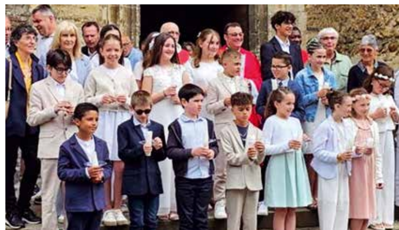
Confirmations à Monein.