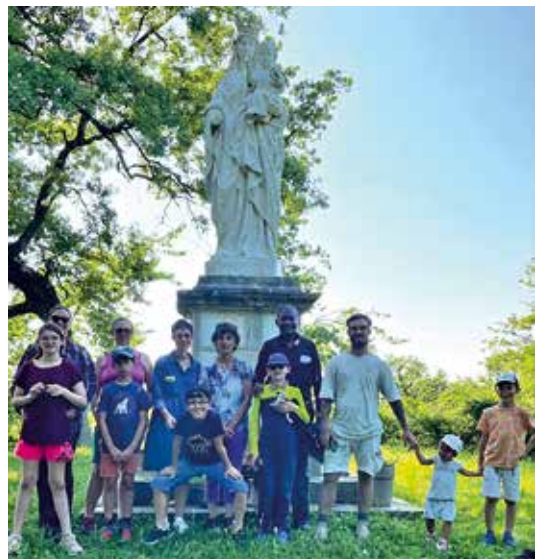
Les enfants ont prié la Vierge de Lahourcade..