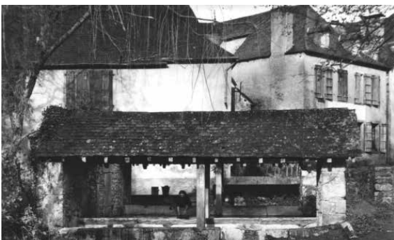
Le lavoir de Masseube.

Notre commune est traversée par plusieurs rues. Partons depuis la mairie. À gauche, la rue Louis-Barthou, homme politique célèbre, avec ses nombreux commerces, nous conduit vers la direction d'Oloron, à la rue de la République, jusqu'à l'auberge de la Promenade. Depuis le monument aux morts, direction Lacommande avec la rue Jéliotte, chanteur français à la cour de Louis XIV. Depuis le cimetière, la rue Jean Bascouret longe la Maison d'accueil rurale de personnes âgées (Marpa) qui donne accès au centre médical, avec la pharmacie, les docteurs et le kinésithérapeute.