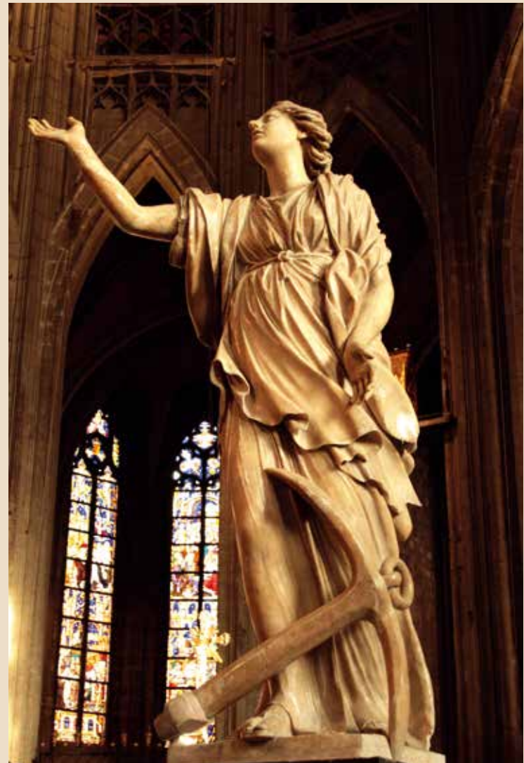
L'espérance, statue en albâtre représentant l'espérance. Élément de l'ancien jubé exécuté par Jacques du Broeucq (1541-45) pour la collégiale Sainte-Waudru de Mons, en Belgique.

Le Catéchisme de l'Église catholique définit l'espérance comme « la vertu théologique par laquelle nous désirons comme notre bonheur le Royaume des cieux et la vie éternelle, en mettant notre confiance dans les promesses du Christ et en nous appuyant sur la grâce du Saint-Esprit » (CEC 1817).