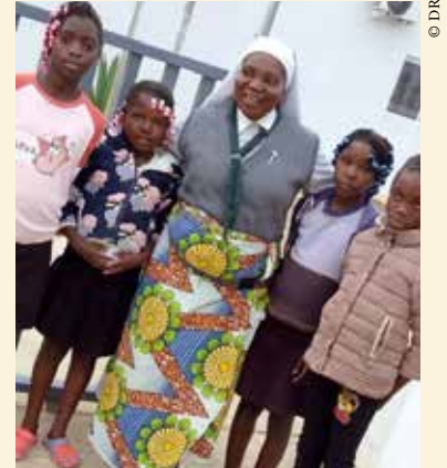
Les bénéficiaires d'une partie de la collecte des Rameaux.