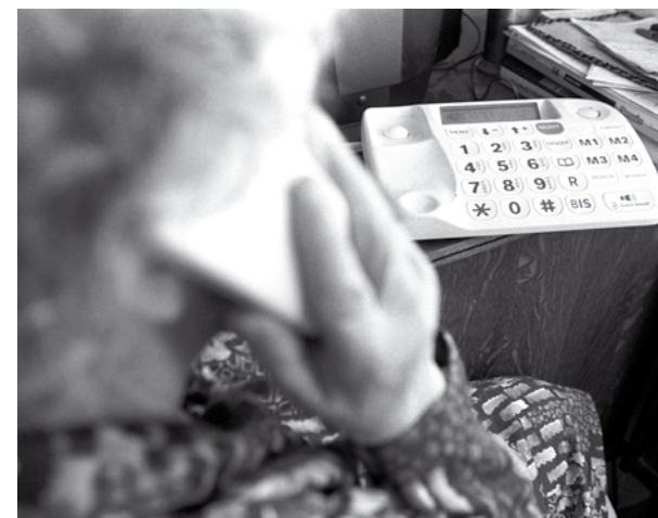
Attention aux arnaques par téléphone !

Organisés parfois en réseaux avec des complices dans des pays étrangers, les voleurs n'ont aucune difficulté à cacher ce qu'ils ont dérobé pour l'écouler ensuite. Dans ce milieu, les « solistes » ou les « artisans » sont de moins en moins nombreux. Avec beaucoup de dextérité, ils utilisent le téléphone et internet pour commettre leurs méfaits. Les victimes sont des individus, des collectivités, des entreprises ou, parfois même, l'État. Si, dans la majorité des cas, il n'y a pas de violence, cela