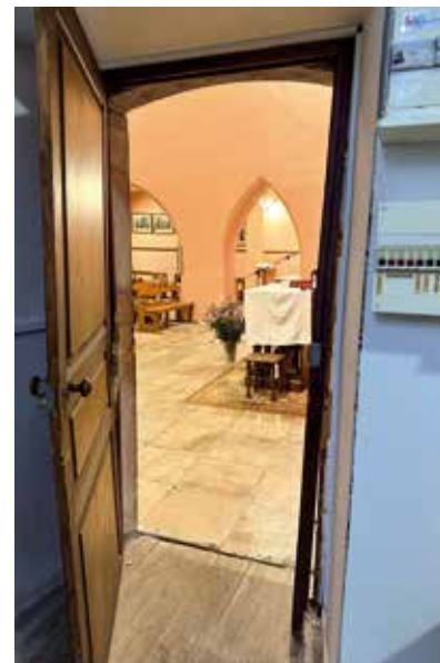
La porte de la sacristie fracturée.

Mais des visiteurs peuvent aussi dégrader nos belles églises fleuries et entretenues par des bonnes volontés qui