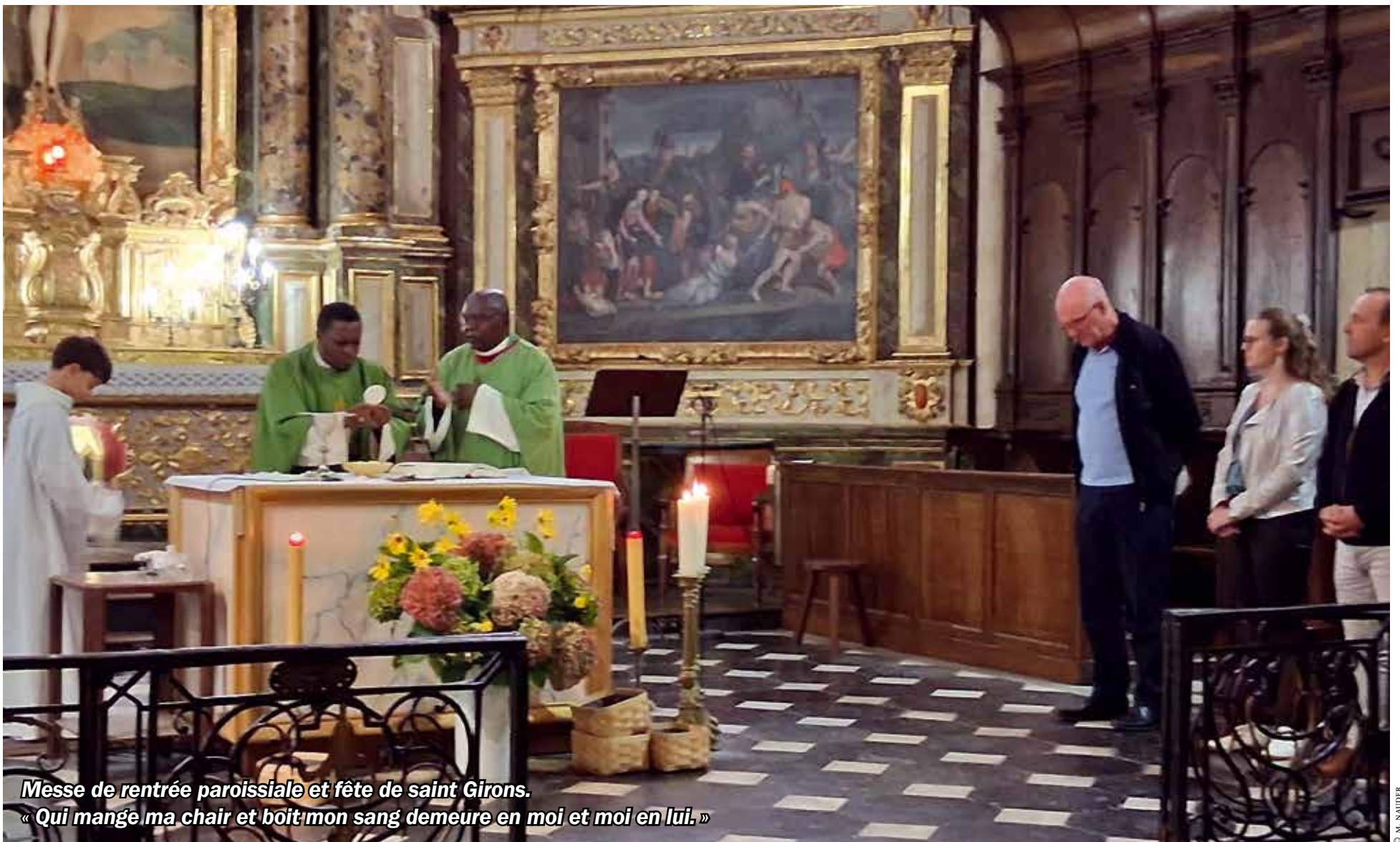
Messe de rentrée paroissiale et fête de saint Girons. « Qui mange ma chair et boit mon sang demeure en moi et moi en lui. »

LE NUMÉRO : 5 € – ISSN 2116-634X – N° 129 – DÉCEMBRE 2025