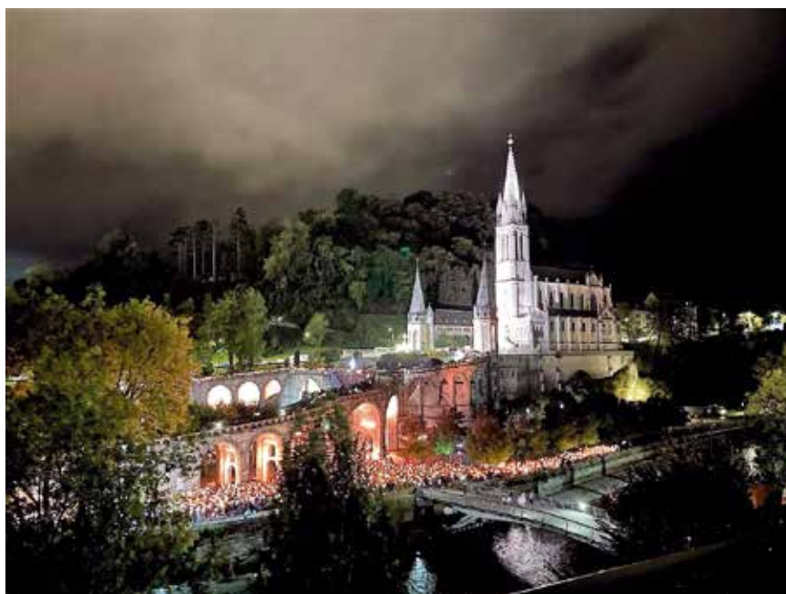
Retraite aux flambeaux vue depuis l'accueil Notre-Dame où logent les pèlerins.