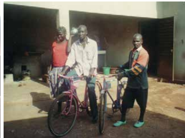
Déchargement d'un conteneur envoyé en Côte d'Ivoire par l'association Les Enfants de Diko.