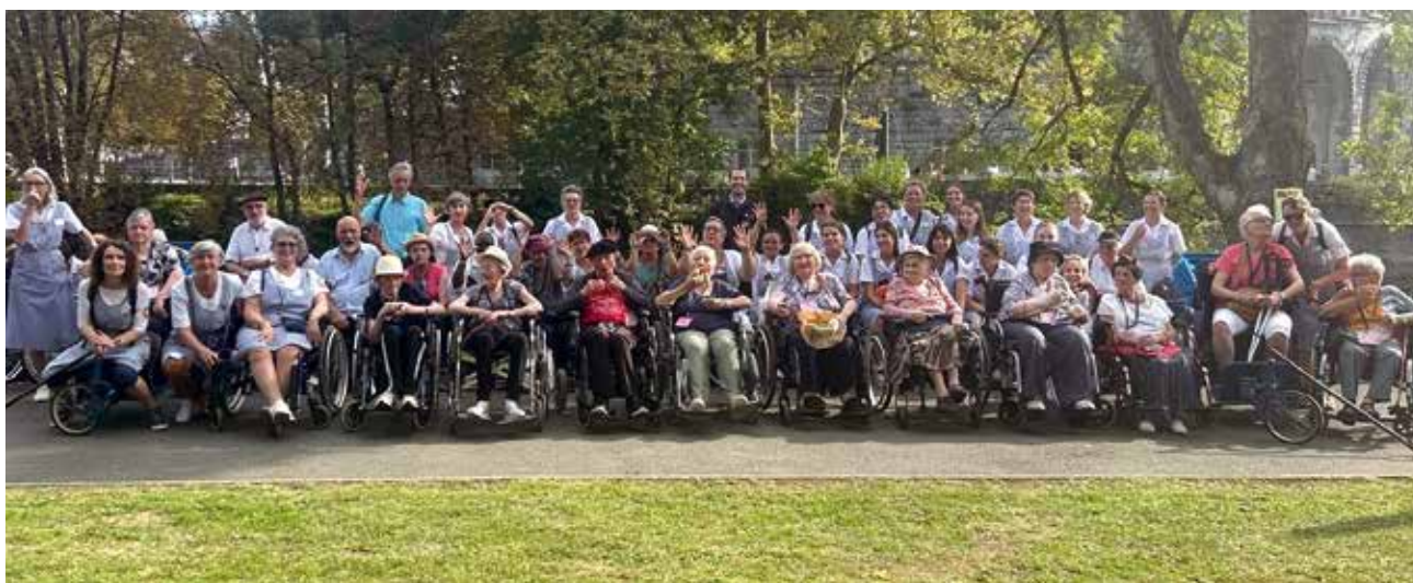
Hospitaliers et malades réunis pour la photo souvenir lors du dernier pèlerinage diocésain de septembre, à Lourdes.

Créée en 1946, l'Hospitalité basco-béarnaise est une association rattachée à notre diocèse de Bayonne, Lescar et Oloron. Elle regroupe des bénévoles, créant une communauté de générosité, de fraternité et de spiritualité, entre eux et les personnes âgées, malades et handicapées accompagnées lors du pèlerinage diocésain, à Lourdes.