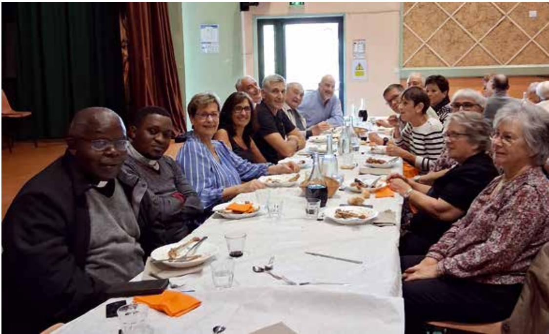
Les organisateurs de cette belle journée.