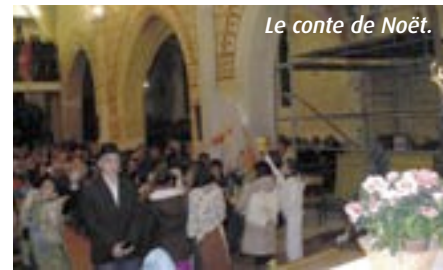
Le conte de Noël.

L'église d'Abos était pleine à craquer au soir de la veillée de Noël, où tous les fidèles des villages alentours se sont recueillis. L'horaire de la messe (19 heures) y est sans doute pour quelque chose. En effet, Noël étant la fête familiale par excellence, il est plus facile de se retrouver et de partager un bon moment en famille après la messe. Un grand nombre d'enfants étaient présents accompagnés de leurs parents et grands-parents, plusieurs d'entre eux nous ont présenté avec beaucoup d'enthousiasme un conte préparé avec leurs catéchistes, où ils ont déposé l'enfant Jésus dans la crèche. La participation de la chorale et de l'orga-