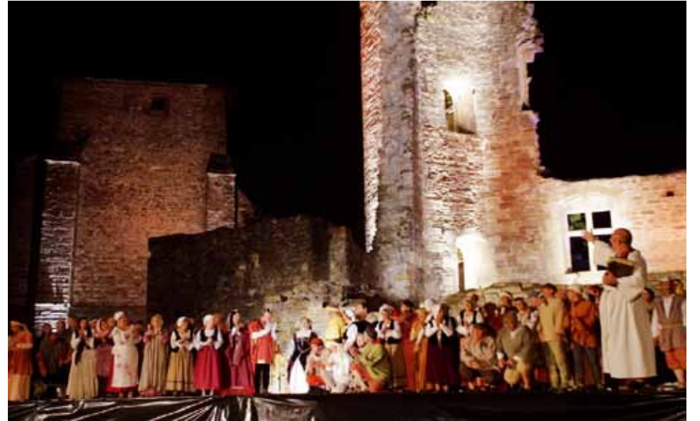
Un des tableaux du spectacle

Les documents historiques ne révèlent pas d'affrontements majeurs entre