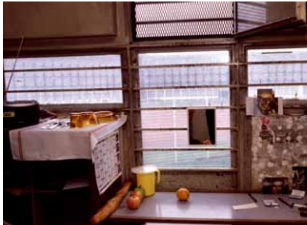
De l'intérieur d'une cellule

Nous avons partagé toutes ces bonnes choses avec les détenues, le personnel de