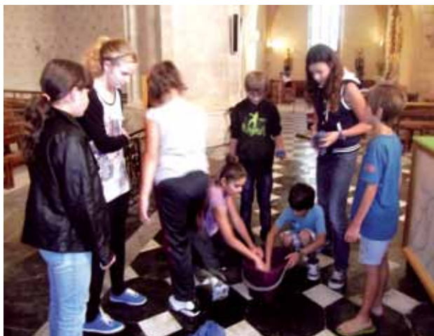
Les jeunes de l'aumônerie au travail à Saint-Girons!

Joie partagée, attention à l'autre, sens du service et l'amitié de Jésus : ce qu'il faut pour bien grandir !