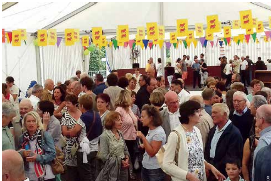
Une belle participation aux fêtes de l'Assomption.