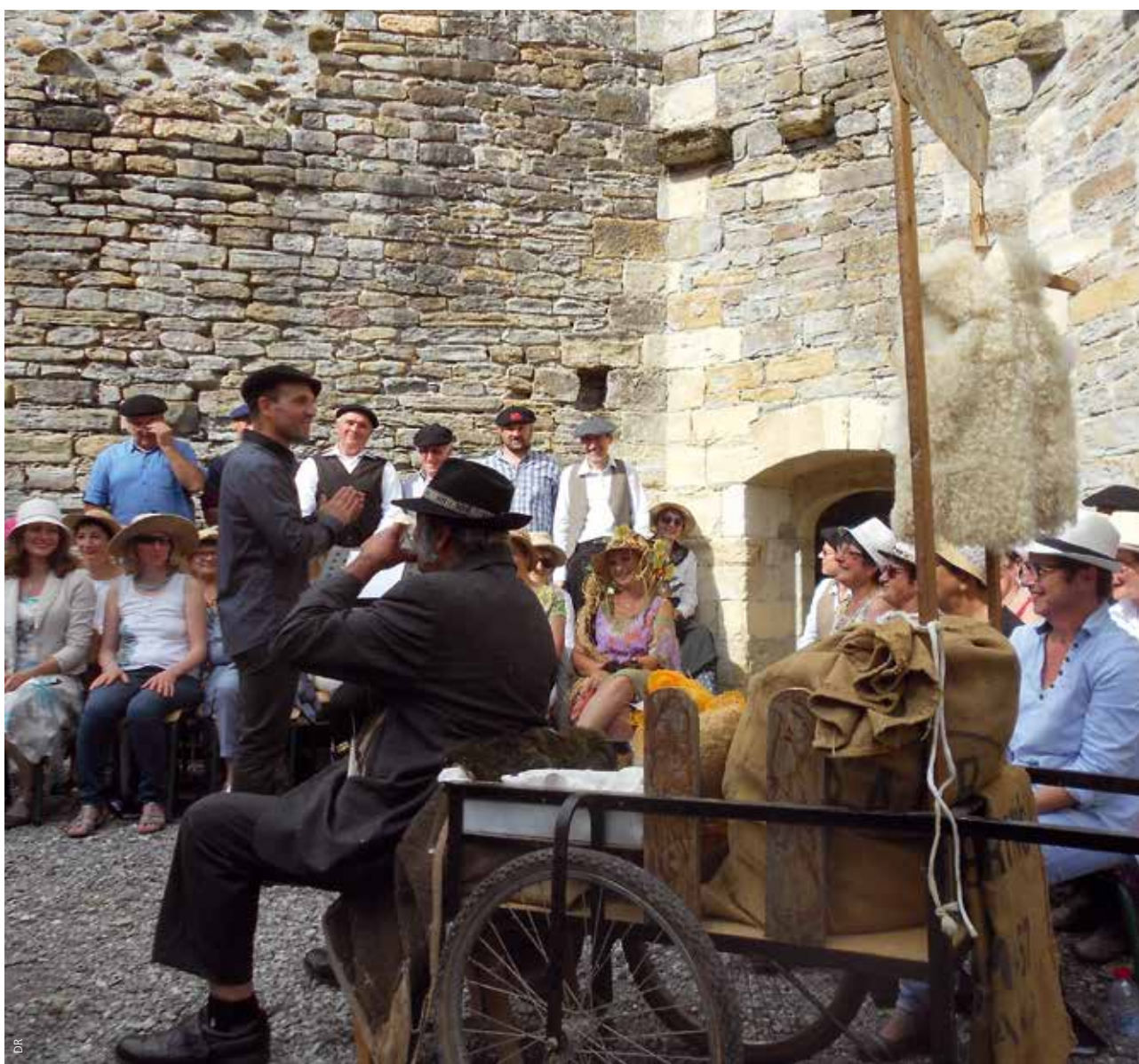
◀ Jeanne d'Albret