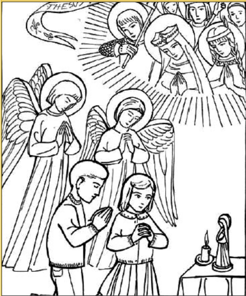
« Saints et saintes du ciel, priez pour nous! »