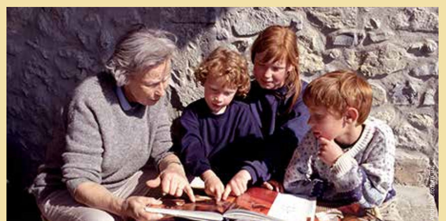
Éveil à la foi et éveil à la vie sont en réalité indissociables, nous dit l'Église.

Pour plus d'informations contactez le presbytère au 05 59 21 30 36