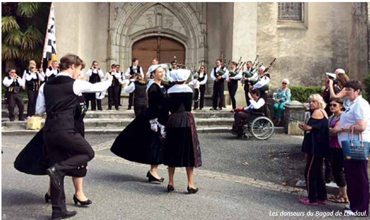
Les danseurs du Bagad de Landaul.

« Que de changements depuis cette époque, les chemins n'étaient pas goudronnés » devait-il nous dire plus tard et d'ajouter : « Par temps de pluie, il fallait enlever la boue des chaussures avant de rentrer dans l'église pour assister à la messe ». En fin de célébration, l'abbé reprenait avec force les paroles du chant d'entrée : « Christ aujourd'hui nous appelle, Christ aujourd'hui nous envoie ». Pussions-nous