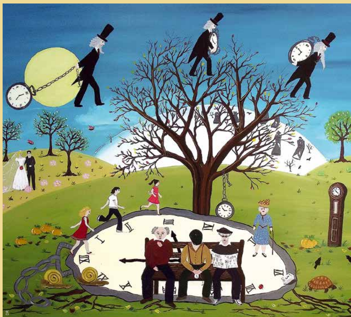
La ronde du temps.