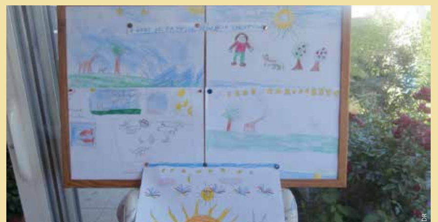
Les enfants apprennent à connaître Jésus à travers des textes, des chants mais également par le dessin.