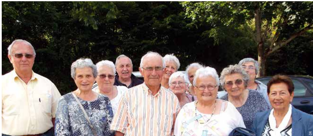
En marche vers Morlaàs.

L'équipe de Monein a rejoint les membres du MCR du Béarn pour le rassemblement diocésain à Morlaàs, le jeudi 8 juin. Nous étions 250 le matin à décou-